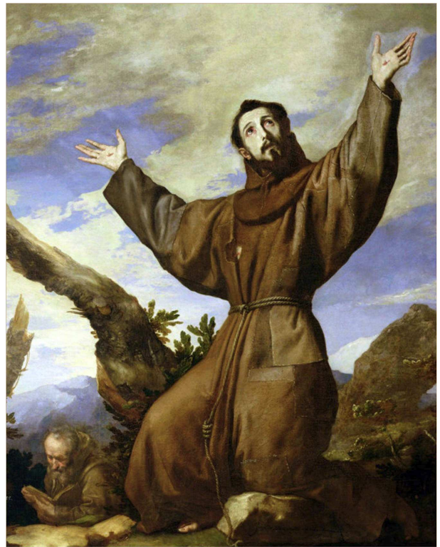
Francis of Assisi