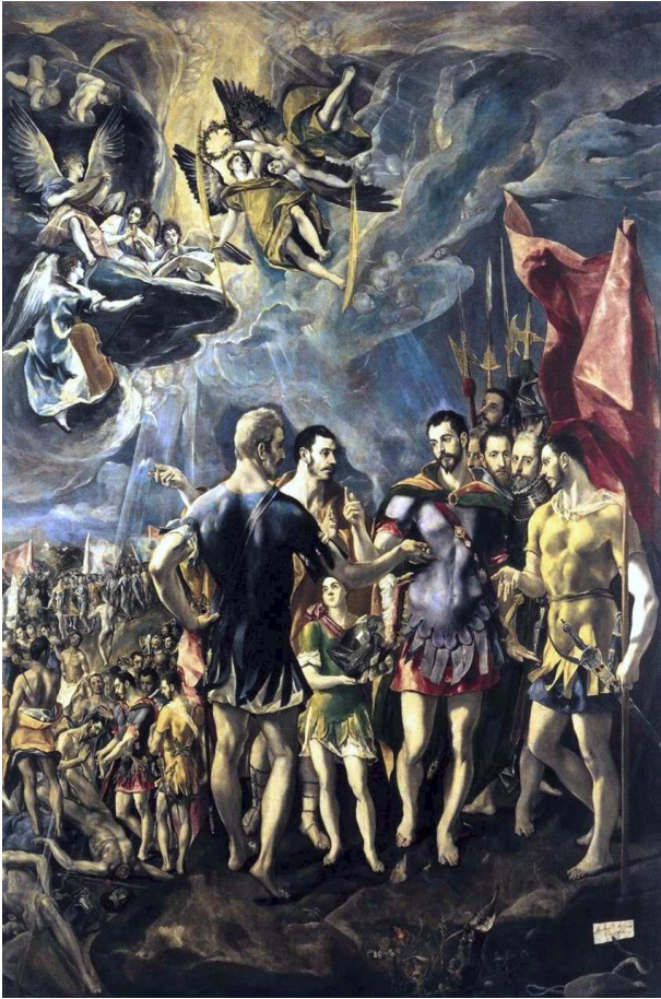
Maurice of Thebes