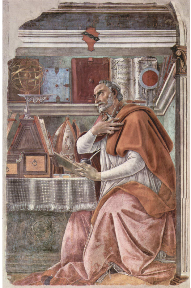
Augustine of Hippo